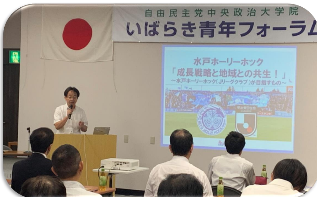
令和元年度いばらき青年フォーラム講座の様子